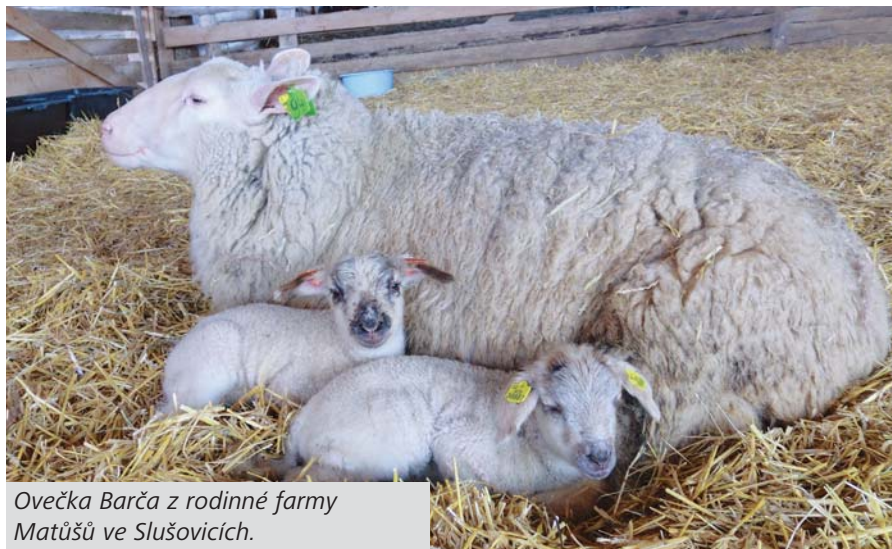
Ovečka Barča z rodinné farmy Matušů ve Slušovicích.

Jedna z nečekávaných věcí je i neplánovaná oprava části vodovodu na sídlišti Padělky. Zde byl během poruchy odhalen žalostný stav stávajícího potrubí, které, ač není nejstarší, vykazuje velkou míru opotřebení. Stavební akce, které budu probíhat, se dotknou úplně všech